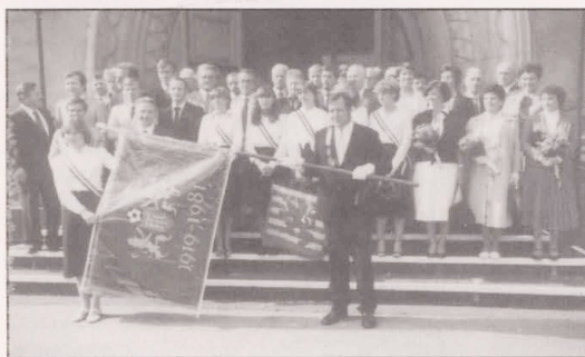
23.08.1981: Nach dem Hochamt