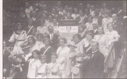
Unser Fahnenträger inmitten der Ehrenjungfern auf der Treppe der alten Schule (19.08.1934)