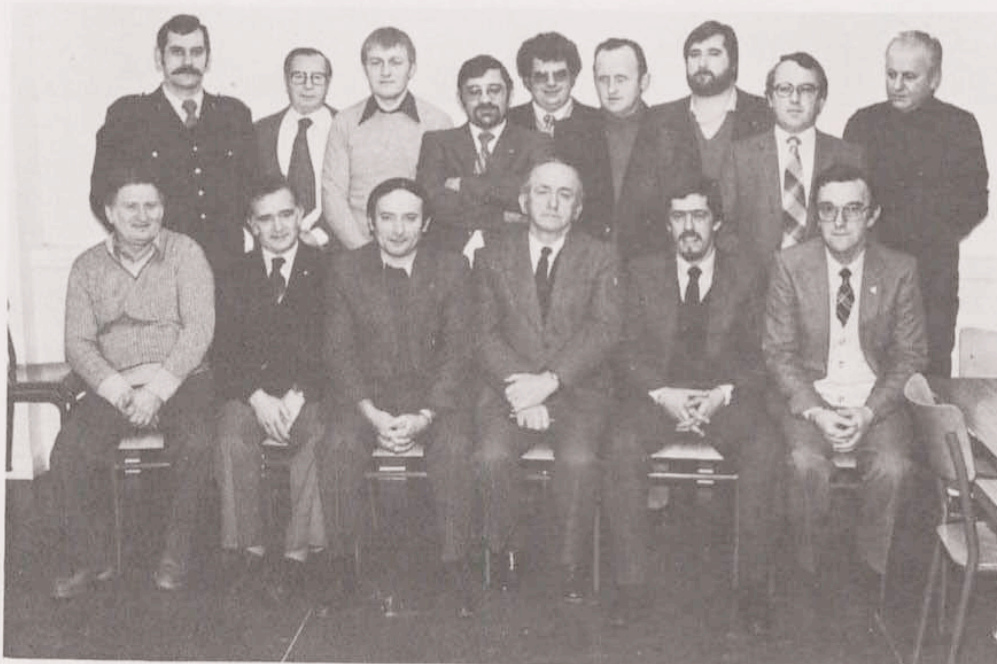
Vorstand: Jahr 1980