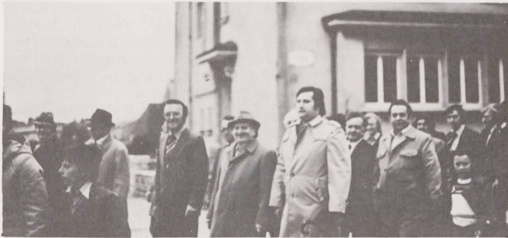
Umzug durch die Straßen von Gasperich nach dem Bezirksmeistertitel im Mai 1979

B: 3-2 / Boewingen-T: 1-1 / T-Bartringen: 5-0 / Christnach-T: 3-3 / Schieren B-T: 0-5 / T-Beggen B: 8-0 / Simmern-T: 2-2. Mit dem Herbstmeistertitel in der Tasche und punktgleich mit Clausen gingen wir in die Rückrunde. Gegen Hamm revanchierte sich die Mft durch einen 2-0 Heimsieg. Auch Clausen wurde klar mit 3-0 im Heimspiel besiegt. Folgt dann: Useldingen-T: 1-1 / T-Red Black B: 2-0 / T-Boewingen: 2-0. In Bartringen verloren wir anschließend nach saft und kraftlosem Spiel gerechterweise mit 2-0. Die Mft schien angeschlagen, gewann aber noch bei Merl B mit 1-0 um sich dann zu Hause den schon fast traditionellen Fehltritt zu erlauben. Mit 2-4 gegen Christnach war die MS in Frage gestellt. Es folgten T-Schieren B: 3-0 und Beggen B-T: 1-1. Nun wars geschehen. Am zweitletzten Spieltag mußten wir unseren ersten Platz an Clausen abtreten. Der letzte Spieltag entwickelte sich zum Hitchkok. Was keiner mehr für möglich gehalten hatte traf ein. Tricolore besiegte logischerweise Simmern im Heimspiel mit viel Mühe 2-1, derweil Clausen ganz unerwartet mit 1-0 in Bartringen verlor. Somit wurden wir mit 1 Punkt Vorsprung und nach spannendem Zweikampf mit Clausen doch noch Bezirksmeister. Aufstieg in die 2 Division. Trainer war SCHANET Mike.