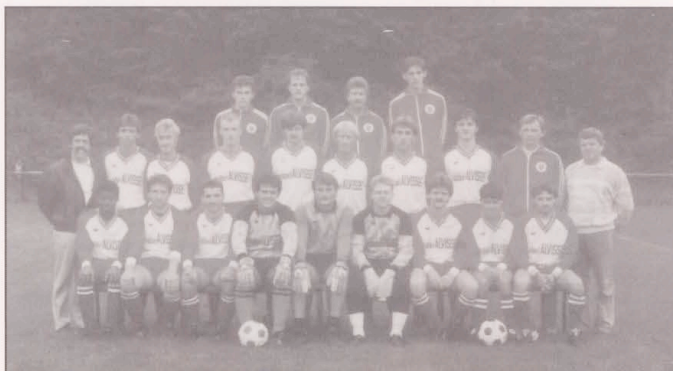
1988/89 Tricolore 1