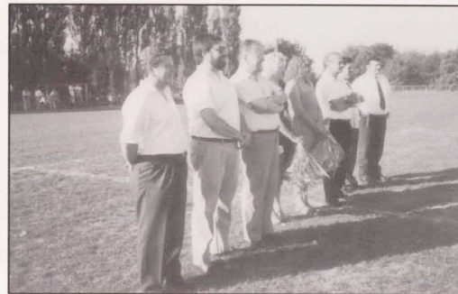
Vor dem Finale