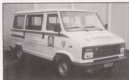
Neuer Minibus des Vereins geliefert am 31.10.1989