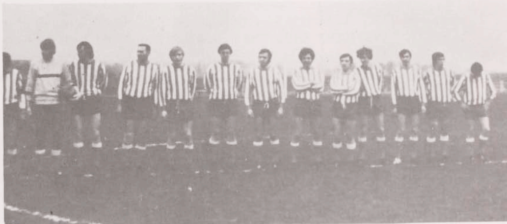
Tricolore's 1. Mft in Wartenberg