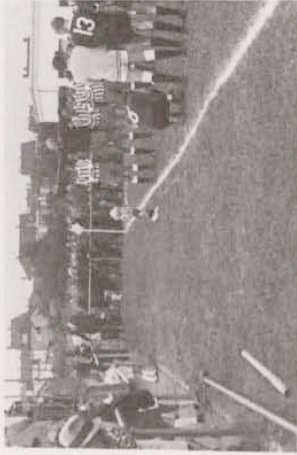
Vor dem Spiel T-Sandweiler

31 August 1969: Spielszene aus dem Finale T-Sandweiler: 3-2. Da unser Gegner im roten Dress spielte, mußten wir kurzerhand unsere rotgestreiften Hemden gegen weiße austauschen. Vlnr: SCHOLTES - SCHROEDER - REDING - SCHANET - HERR