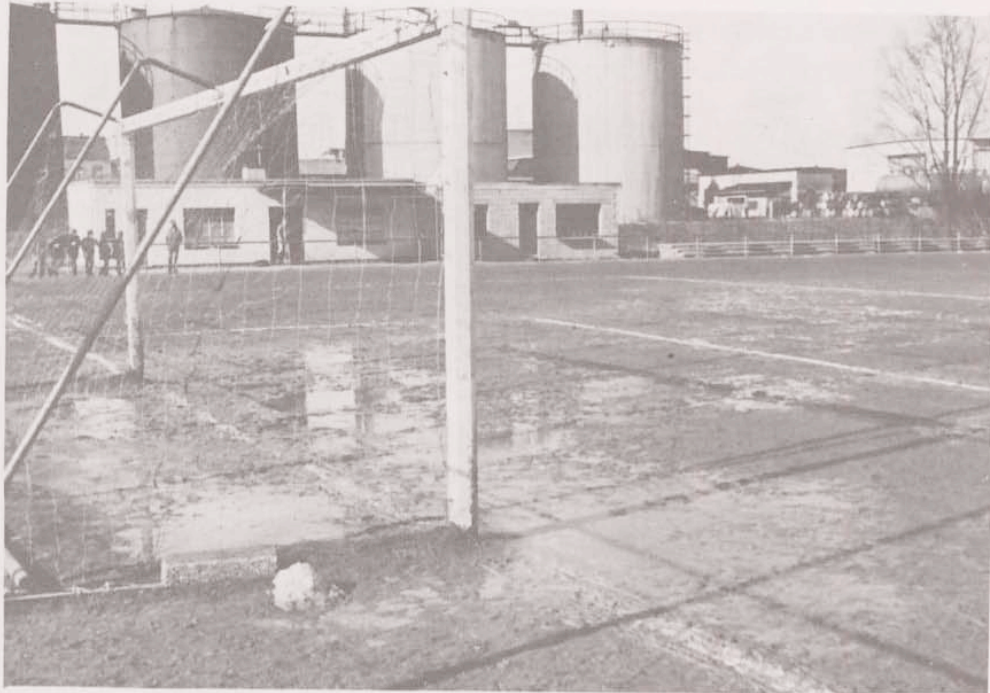
Die Umkleideräume Anfang der siebziger Jahre