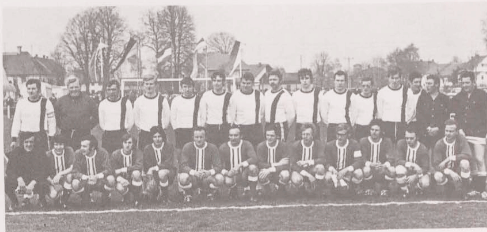
Tricolore's 2. Mft in Wartenberg: stehend die 1. Mft aus Wartenberg