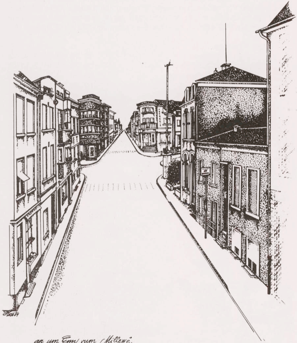
an um Em rum Millewë.