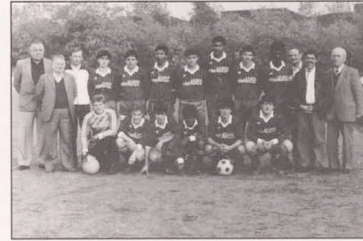
Jrs. 1986/87 Bezirksmeister der 4 Klasse : stehend v.l.n.r. :