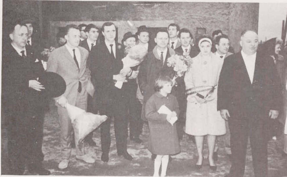
1964: Empfang in Gasperich nach dem geglückten Aufstieg in die 1. Division