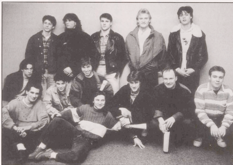
28.01.1994: Ein Teil der anwesenden Spieler bei guter Laune

Amicale Spuerverein FC Tricolore-Gasperich