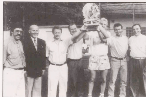
Tricolore strahlender Sieger im «Dall»

- Am 11+15.8. Teilnahme an der Coupe LANG in Hesperingen T-Remich: 2-5 (MEYER - DARROSA) T-Eischen: 5-1 (MEYER 3 - MANELLI - BRAUN) 3. Platz