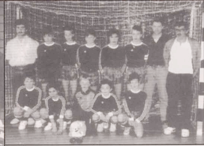
Minimes: Landesmeister IN DOOR CHAMPIONNAT