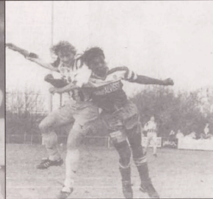
Tricolore - Beggen 0-3