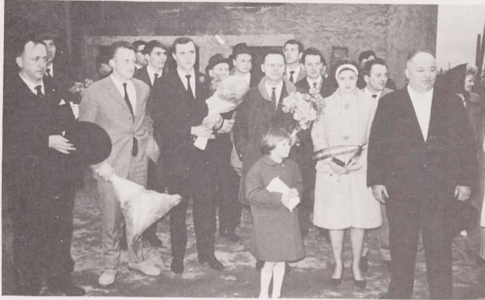
1964: Empfang in Gasperich nach dem geglückten Aufstieg in die 1. Division