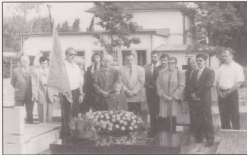
Kranzniederlegung beim Verstorbenen

- Am 19+21+23 August 1992, Coupe BRAUSCH Jos in Gasperich