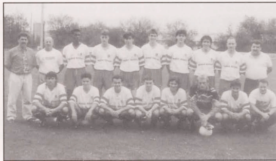
Coupe Brausch Jos: Tricolore Mannschaft