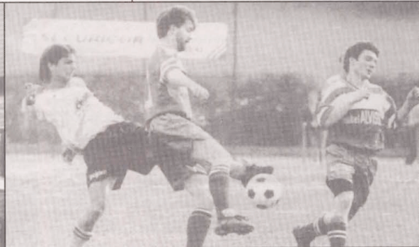
Coupe de Luxembourg: Tricolore - Niederkorn 2-1