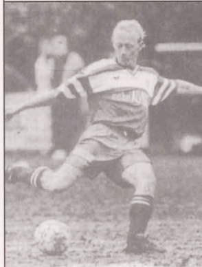
Coupe de Luxbg: Tricolore - Hautcharage 3-1