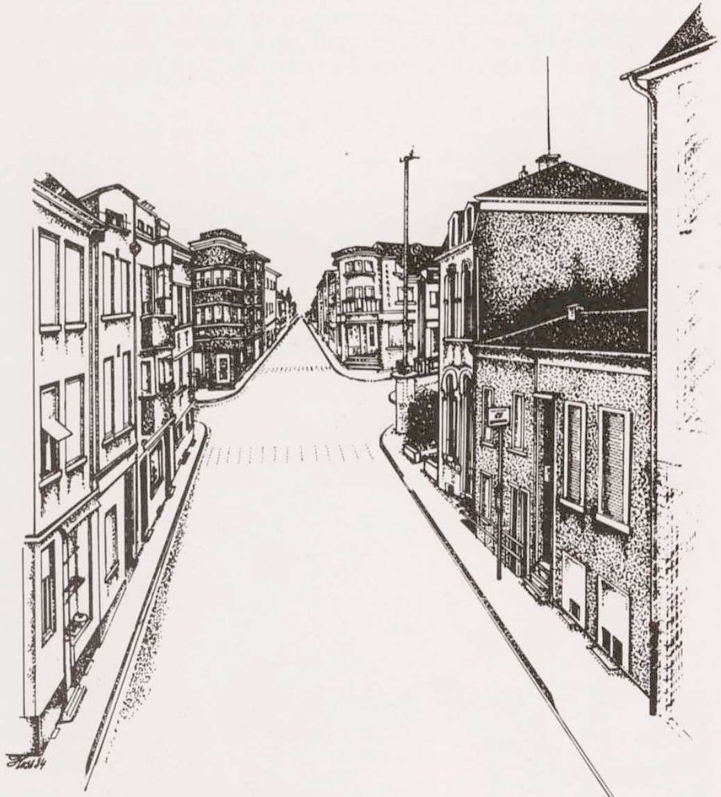
an um Em rum Millewë.