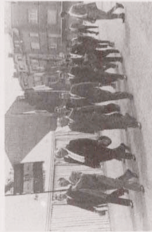
Umzug durch die Straßen von Gasperich