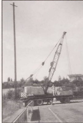
Abriss am 14.06 89