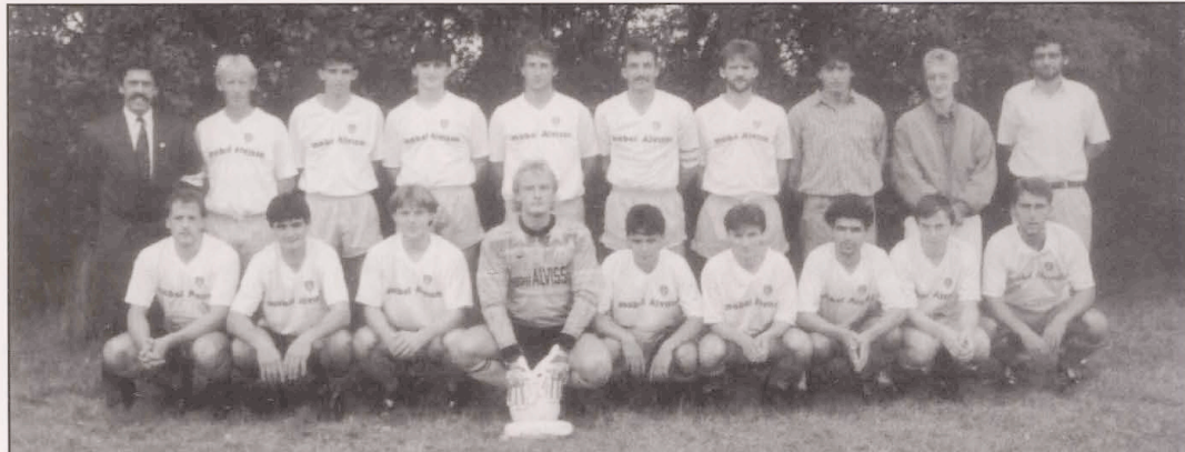
Tricolore Mannschaft Coupe STOLTZ