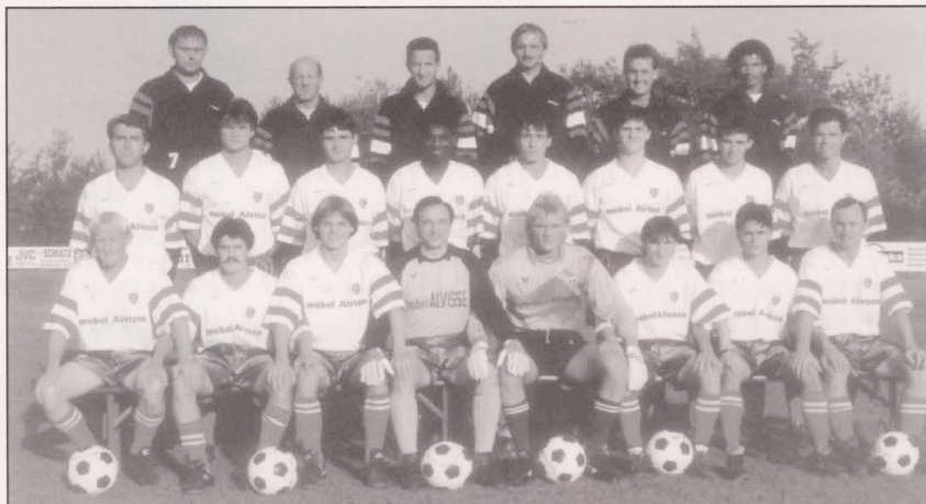
Kader 1 Mft 1991/92

3. NIEDERKORN - T: 2-0 Der erste Rückschlag, wir waren nicht schlechter als Niederkorn, konnten unsere Gelegenheiten aber nicht verwerten.