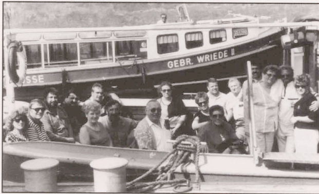
Ausflug der AMICALE FC TRICOLORE nach Hamburg Juni 1992