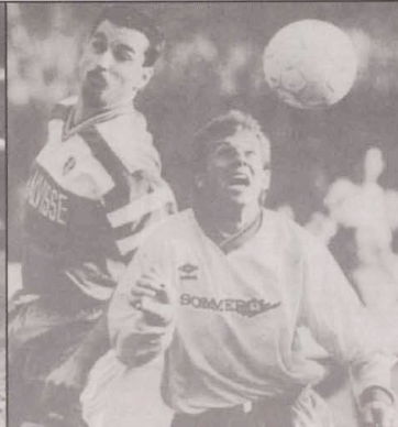
Championnat: Tricolore - Wiltz 3-1