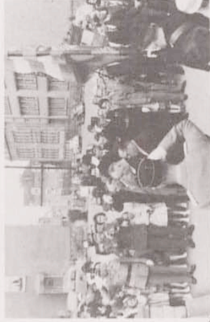
Kranzniederlegung beim Monuments aux Morts