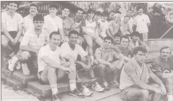
Gute Laune beim ersten Training

Die Sportpresse stempelte uns zu den 4 Favoriten des Bezirks. Mitte des Jahres stellte die Gemeindeverwaltung dem Vorstand erstmals Pläne von den neu zuerbauenden Umkleieräumen mit Klubhaus vor.