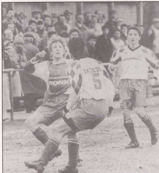
Coupe de Luxembourg Tricolore - Grevenmacher

T-Grevenmacher: 1-3 (ACKER) Das Spiel wurde von RTL aufgezeichnet