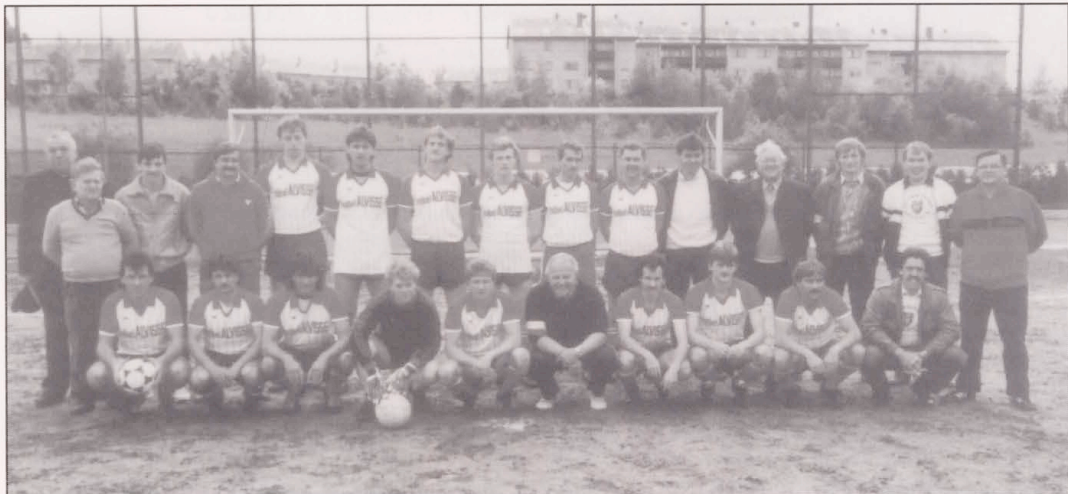
08.06.86: Vor dem letzten Meisterschaftsspiel TRICOLORE - BIWER

2 JCM Ascenseurs · 428, rte de Longwy · Luxembourg