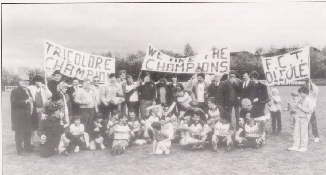
08.06.86: Empfang auf dem Spielfeld

In der Coupe de Luxbg, nach Siegen gegen Lamadelaine (2-0), AS Luxbg. (1-0) und in Hamm (1-4) bescherte uns das Los ein Heimspiel gegen Steinfort, der alte Verein unseres jetzigen Trainers. Da lag Pulver in der Luft.