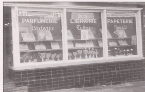
Austellung der Pokale