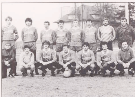
Coupe de Luxbg. ETZELLA - TRICOLORE 1-1 n.V. (Februar 1986)

Fast wäre uns die Riesensensation geglückt. Erst in der 88 Minute glich Etzella 1-1 aus. Auch die Verlängerung hielten wir durch, also kam es 4 Tage später bei klirrender Kälte zu einem 2. Spiel, diesmal auf unserem Platz.