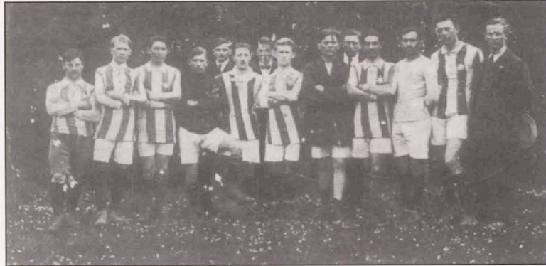
Die ersten Pioniere