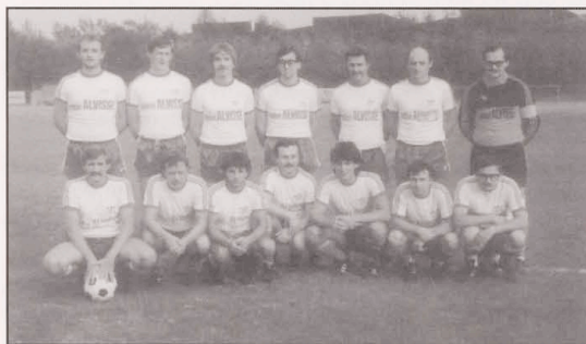
2. Mannschaft FCT Coupe Jean MULLER