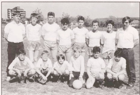
1986/87 Scolaires stehend v.l.n.r.:

Tricolore Bezirksmeister und Aufstieg in die höchste Spielklasse dieser Kategorie (1 Klasse)