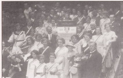
Unser Fahnenträger inmitten der Ehrenjungfern auf der Treppe der alten Schule (19.08.1934)