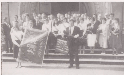
23.08.1981: Nach dem Hochamt