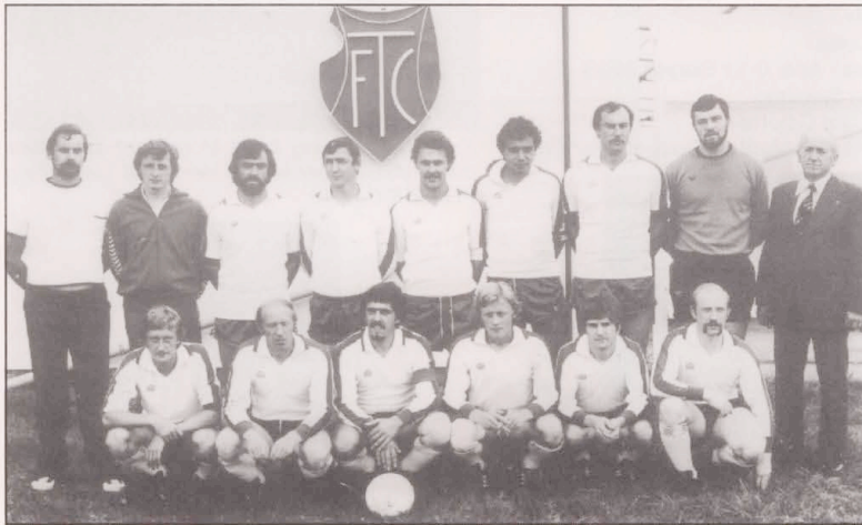
August 1979 «Soixentenaire» FC Tricolore