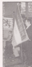
Neue Fahne FC TRICOLE