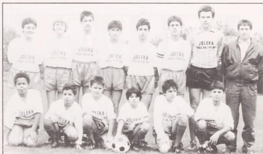
1988/89 Scolaires hockend v.l.n.r.:

13 + 14 Juin 1987, Teilnahme an einem internationalen Turnier in Langenfeld (BRD) Tricolore: 8. Platz