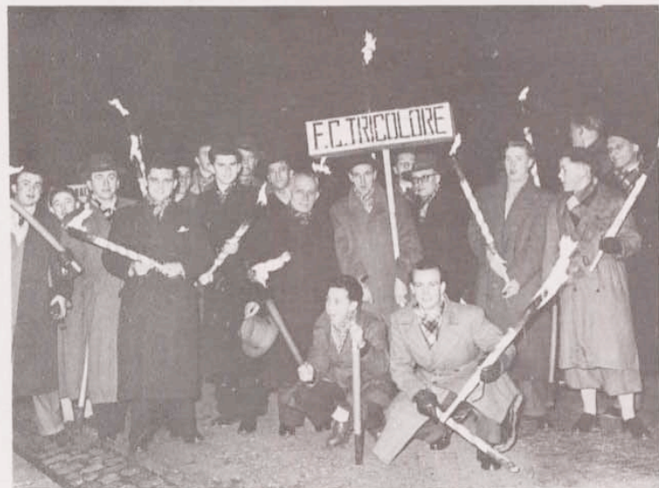
Januar 1954: Teilnahme am Fackelzug