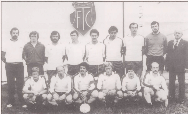
August 1979 «Soixentenaire» FC Tricolore