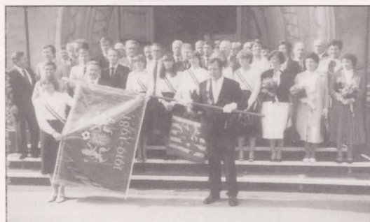
23.08.1981: Nach dem Hochamt