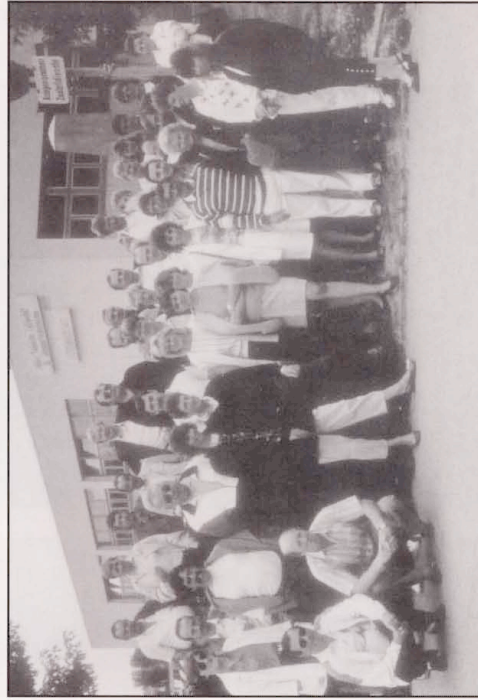
1989: Die Gruppe kurz vor der Abfahrt nach München