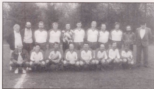
Section Folklore Grupp "Aal Gasperich"