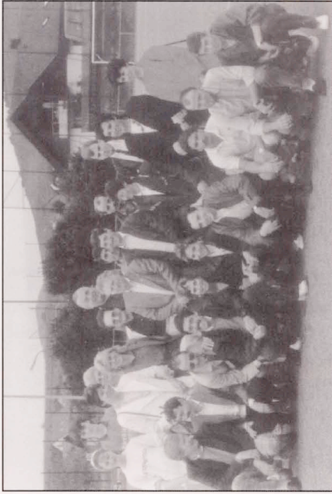
1987: Ein Teil der gutgelaunten Gruppe auf dem Spielfeld von Altschweier