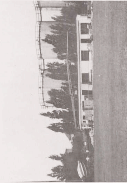
Während dem Auffüllen mit Beton ▶