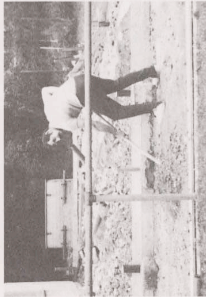
◀ Nach Abriß des hölzernen Geräteschuppens, die Fundamentsarbeiten...