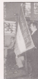
Neue Fahne FC TRICOLE