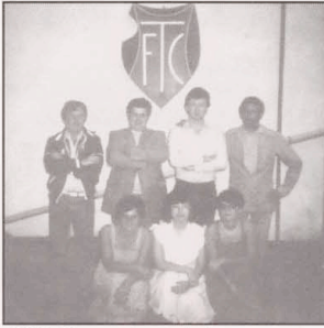
1981 Supporterclub † ALLEZ TRICOLORE