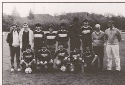
Jrs. B 1987/88 stehend v.l.n.r.:

Sieger: AS Differdingen Tricolore 2. Platz