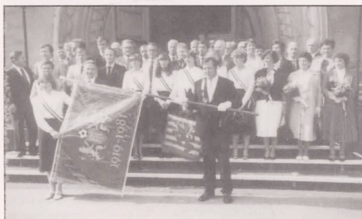
23.08.1981: Nach dem Hochamt