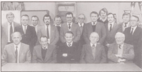
1984 Organisationsvorstand 65 FCT