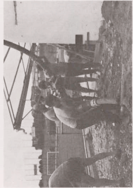
◀ Auffüllen mit Beton...