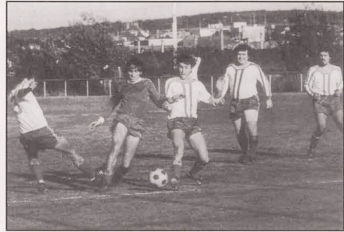
September 1977 Szene C. Lux: T - Aspelt 5-3