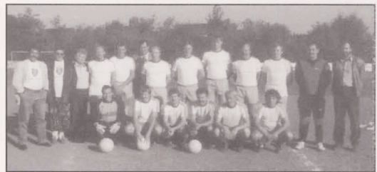
25.05.1990 Konveniat früherer Tricolore Spieler