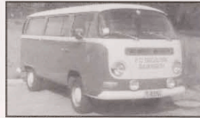
1981 1. Bus