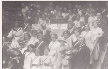
Unser Fahnenträger inmitten der Ehrenjungfern auf der Treppe der alten Schule (19.08.1934)