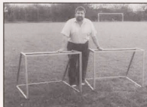
1992: "Dem Änder sei Wierk"