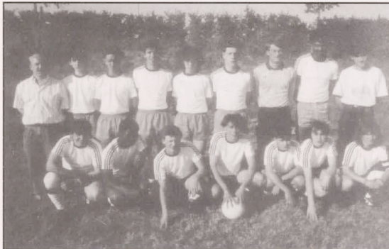
31 Mai 1989, Halbfinale: Grevenmacher - T: 2-1

Erstmals stand eine Tricolore Jugendmannschaft im 1/2 Finale. In Bestbesetzung (also mit den 3 Spielern aus der 1. Mft) traten wir voller Selbstbewusstsein in Grevenmacher an.