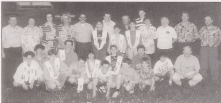
Meisterfeier mit unseren Minimes

Commission des Jeunes FC Tricolore-Gasperich