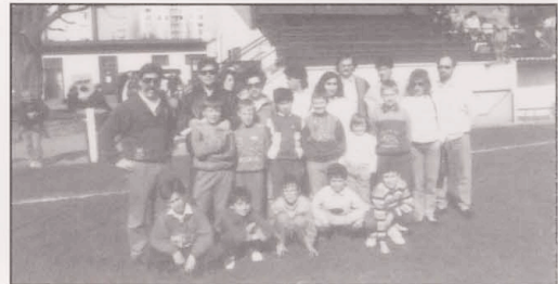
1989 Poussins in Tavernez