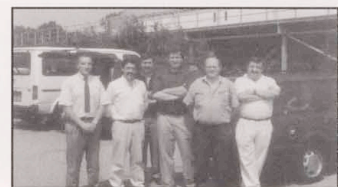
1993 Sponsorvertrag mit PUMA in Bruxelles