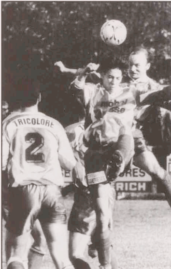
10.10.93: Spielszenen Tricolore-Diekirch

7. MERTZIG-T: 1-3 (GRETHEN-LLAMAS 2) Trotz zweier gelb-roten Karten für GRETHEN und LANGERS verteidigten 9 Tricolore Spieler heroisch den rausgespielten Vorsprung.