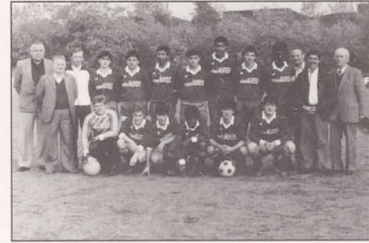
Jrs. 1986/87 Bezirksmeister der 4 Klasse : stehend v.l.n.r. :