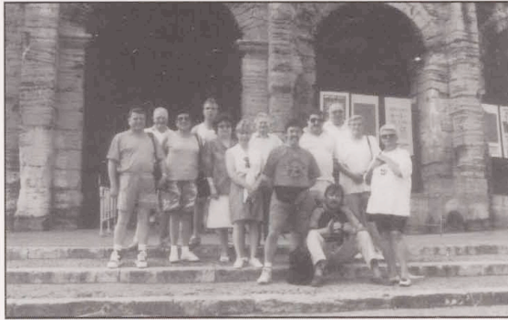
Ausflug der AMICALE FC TRICOLORE in die Provence Juni 1993