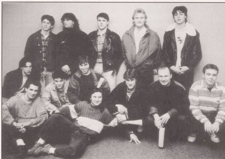
28.01.1994: Ein Teil der anwesenden Spieler bei guter Laune

Amicale Spuerverein FC Tricolore-Gasperich