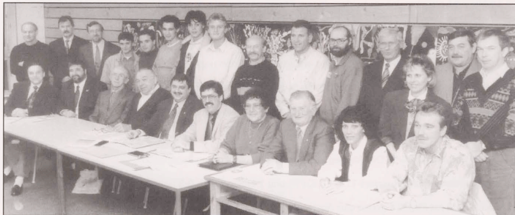
28.01.1994: Vorstand mit den geehrten Mitgliedern