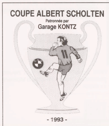
Deckelseite der Broschüre