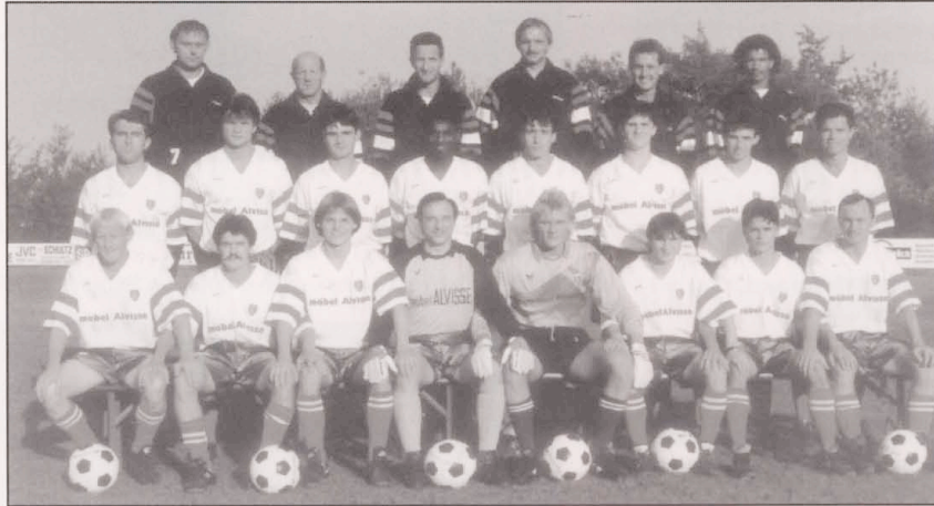
Kader 1 Mft 1991/92