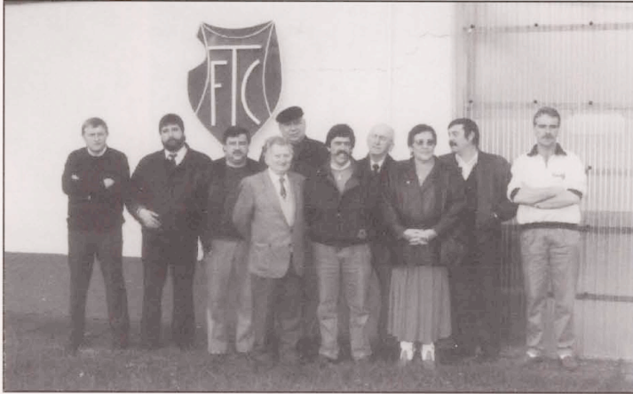
Der Vorstand bei den Vorbereitungsarbeiten