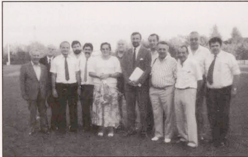
Nach dem Turnier .....