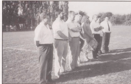
Vor dem Finale