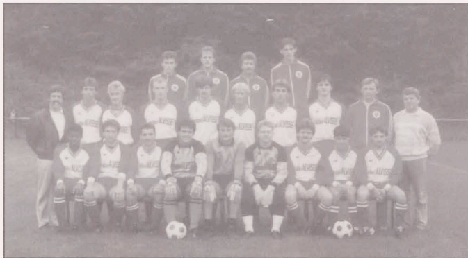
1988/89 Tricolore 1

gelang ein hauchdünner 1-0 Sieg, ein weiterer 3-1 Sieg gegen Angstgegner Itzig, 1-1 bei The National und 1-1 gegen RM Luxbg passten gut in unser Konzept. Noch aber waren wir nicht gerettet, hatten jedoch Anschluss an das Mittelfeld gefunden. Ein 1-5 Sieg in Bartringen, und der Klassenerhalt war in greifbare Nähe gerückt. 0-1 verloren wir in Gasperich gegen Aufstiegs kandidat Sanem. Der letzte Spieltag entscheidet wer schliesslich mit Bartringen und Itzig absteigen sollte. Wir mussten bei Stade antreten. Ein Spiel nichts für schwache Nerven. Als nach 90' Schiedsrichter Stadtfeld das Spiel mit 0-0 abpfiß, fielen sich die Tricolore Spieler um den Hals, hatten sie doch dank starker kämpferischer Leistung und exemplarischen Einsatz den Klassenerhalt geschafft und Stade, der Traditionsverein, musste absteigen.