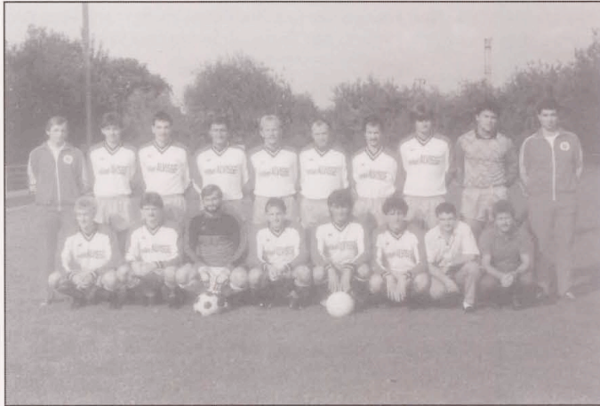
1 Mft 1987/88