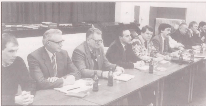
Vorstand 1989 während der Generalversammlung