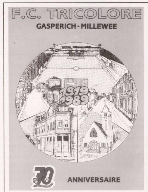
Deckelseite der prächtigen Festbroschüre