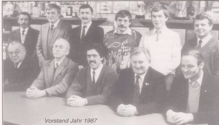
Vorstand Jahr 1987

Im ersten Spiel nach der Winterpause blamierten wir uns bis auf die Knochen und mit 0-5 unterlagen wir gegen Diekirch. Eine weitere Niederlage in Vianden (4-3) und wir rutschen auf einen Abstiegsplatz. Folgte ein schwer erkämpfter 4-3 Sieg gegen Clerf. Erneute Niederlagen in Mersch (2-1) sowie in den Heimspielen gegen Junglinster (0-2) und Hobscheid (1-4) besiegelten unser Schicksal und wir standen als sicherer Absteiger fest. Die letzten 3 Spiele waren nur noch Formsache und 2 Niederlagen gegen Medernach und Redingen sowie einem Abschlussieg in Bissen änderte nichts mehr an unserer Lage.