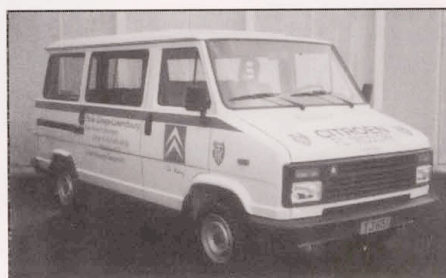
Neuer Minibus des Vereins geliefert am 31.10.1989