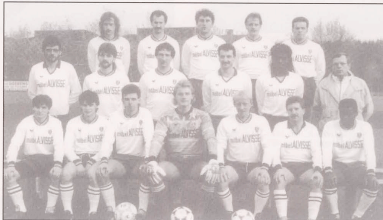
Die Meisterelf 1989/90

Nach einem weiteren 2-1 Sieg gegen Mühlenbach wurden wir von der Sportpresse als ernsthaften Aufstiegskandidat gehandelt. Ein überzeugender 2-0 Sieg in Hostert (SCHOLTEN-ACKER) brachte uns erstmals die Führung in der Tabelle. Das 0-0 im Heimspiel gegen Merl entsprach erwartungsgemäss nicht unseren Vorstellungen. The National-T: 1-2 ein hart umkämpfter wichtiger Sieg gegen einen direkten Verfolger. Nach dem Ausscheiden aus der Coupe de Luxembourg (US Düdelingen-T: 3-0) trafen wir auf die Elf von Bettemburg. Die 100 Zuschauer erlebten ein selten schwaches Spiel, nur der 1-0 Sieg (STOLTZ) passte in unser Konzept. In Weimerskirch verschliefen wir die 2te Halbzeit mit viel Glück, gewannen trotzdem das Spiel mit 2-1. Somit waren wir ungeschlagen Herbstmeister .