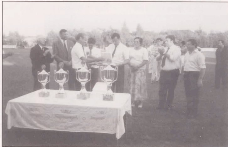
Empfang der Ehrengäste