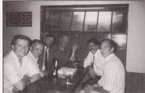
.....in geselliger Runde